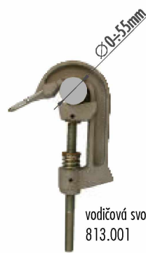
vodičová svorka 813.001